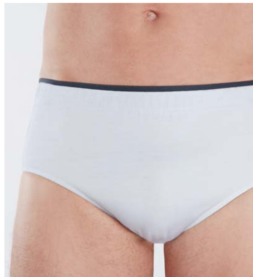
Réf 8620 BOXER INTRAVERSABLE