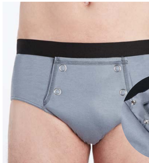
Réf 8670 BOXER INTRAVERSABLE