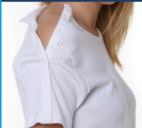
Réf 8102 TEE-SHIRT MIXTE MANCHES COURTES OUVERTURE MANCHES AIMANTS