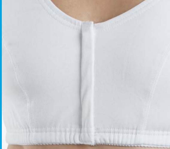
Réf 8153 BRASSIERE OUVERTURE DEVANT