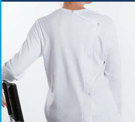
Réf 8101 TEE-SHIRT MIXTE MANCHES LONGUES OUVERTURE DOS PRESSIONS