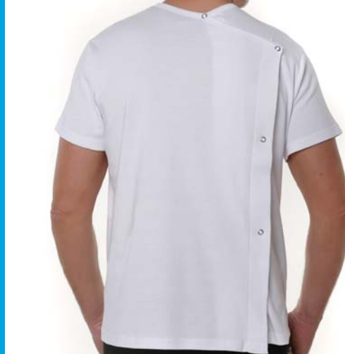
Réf 8100 TEE-SHIRT MIXTE MANCHES COURTES OUVERTURE DOS PRESSIONS