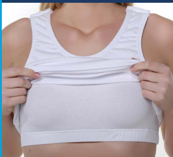
Réf 8152 DEBARDEUR BRASSIERE INTEGREE OUVERTURE EPAULES AGRAFES

Maintien et confort sans avoir à enfiler de soutien gorge